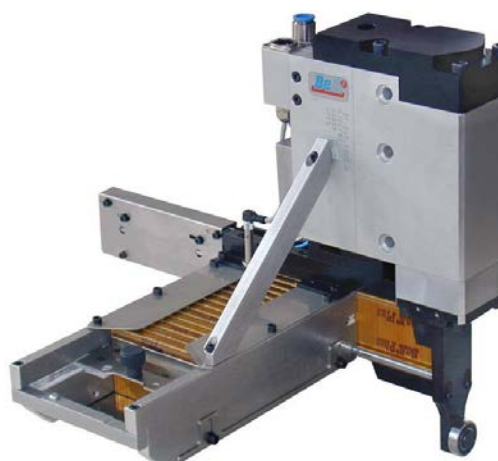
postranní zásobník - pravý