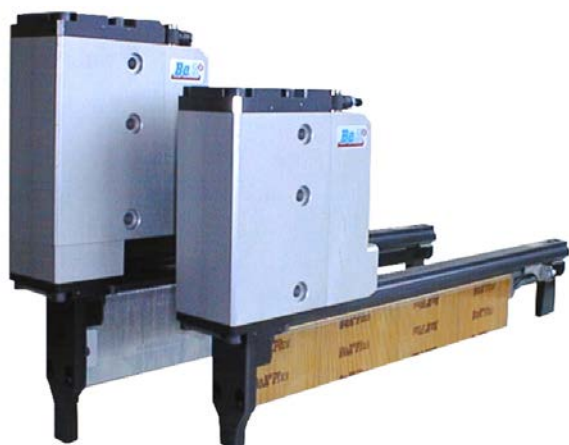
rovný prodloužený zásobník