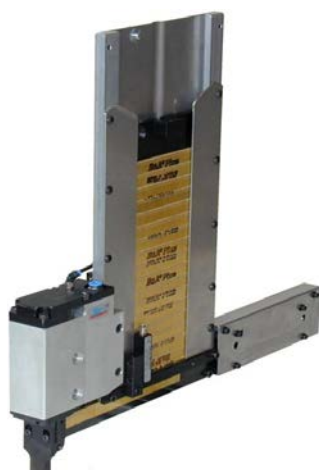
svislý zásobník - levý