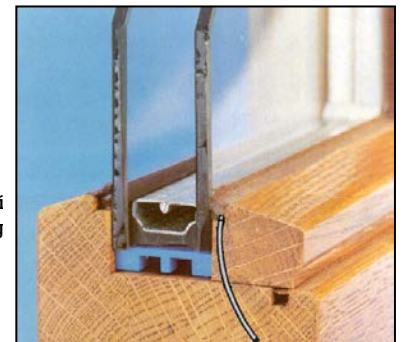
detail připevnění zasklívací lišty