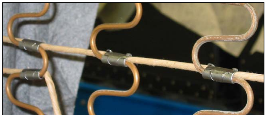
spona Vertex, detail hotového spoje